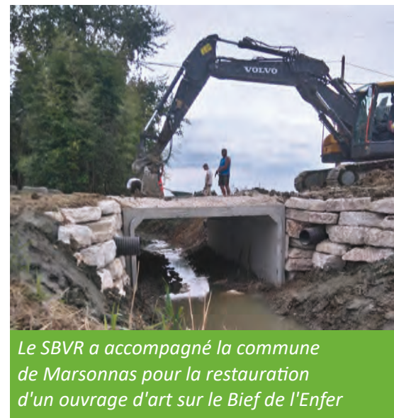
Le SBVR a accompagné la commune de Marsonnas pour la restauration d'un ouvrage d'art sur le Bief de l'Enfer

Le syndicat agit aussi pour le compte des communes en concevant et supervisant les travaux.