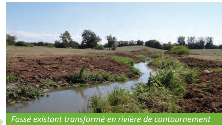
Fossé existant transformé en rivière de contournement

Moulin Peloux - Coût de l'opération : 279 000 € HT Moulin Gaulin - Coût de l'opération : 233 000 € HT Moulin Neuf - Coût de l'opération : 160 600 € HT Moulin de Brêt - Coût de l'opération : 325 000 € HT