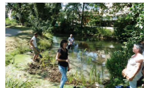
Plantation de plantes aquatiques dans la Reyssouze avec les habitants du quartier " Reyssouze " à Bourg-en-Bresse à l'occasion de leur fête annuelle