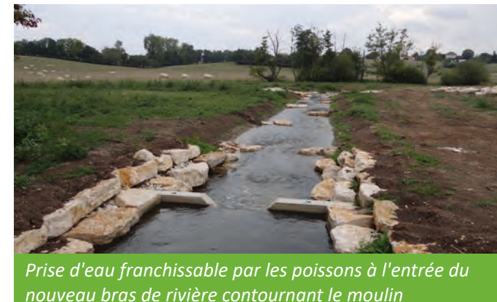
Prise d'eau franchissable par les poissons à l'entrée du nouveau bras de rivière contournant le moulin