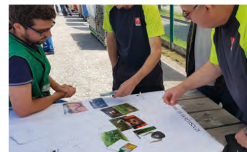
Participation à la " Green Week " de Renault Trucks Bourg-en-Bresse pour valoriser le patrimoine naturel du Déborah auprès de 1700 agents du site industriel