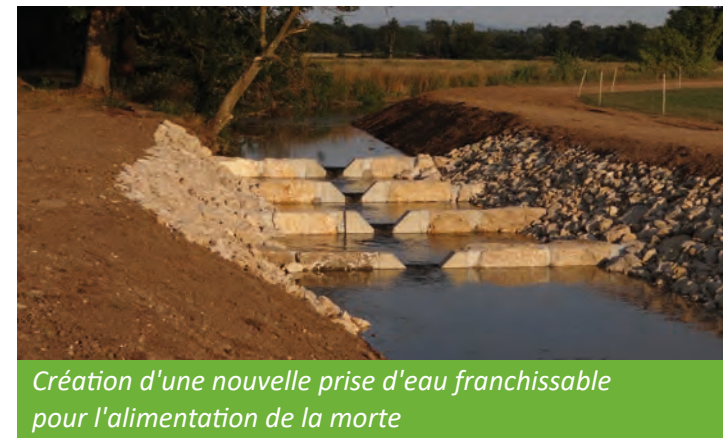
Création d'une nouvelle prise d'eau franchissable pour l'alimentation de la morte