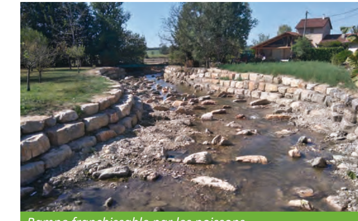
Rampe franchissable par les poissons remplaçant la vanne clapet et remblaiement de l'ancien bras d'amenée d'eau