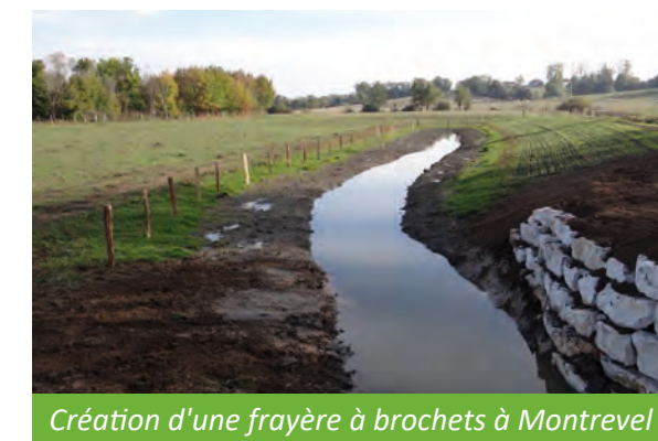
Création d'une frayère à brochets à Montrevel

Le syndicat intervient également pour la mise en œuvre d'actions volontaires en faveur de la biodiversité . Un rapprochement avec Renault Trucks a notamment permis de gérer des foyers de Renouée du Japon par la pâture de moutons et de supprimer deux obstacles sur le ruisseau du Dévorah. Des partenariats avec des associations (CONCORDIA, maison de l'Europe et des européens, FRAPNA) ont également contribué à lutter contre le Myriophylle du Brésil à Viriat.