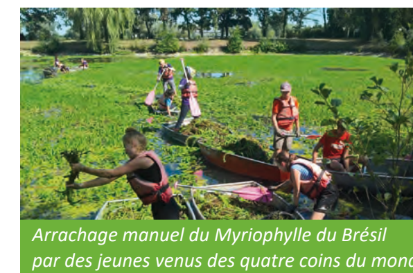
Arrachage manuel du Myriophylle du Brésil par des jeunes venus des quatre coins du monde