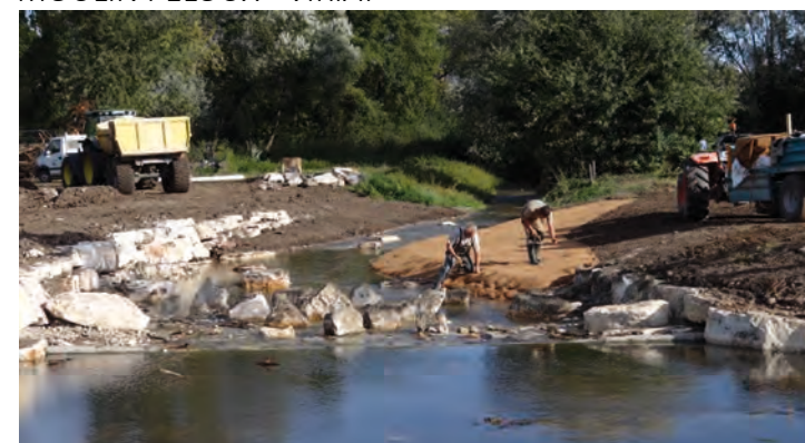
Aménagement d'une banquette à l'aval de la rampe en enrochements