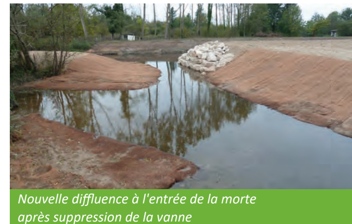
Nouvelle diffluence à l'entrée de la morte après suppression de la vanne