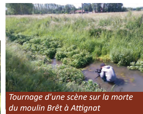
Tournage d'une scène sur la morte du moulin Brêt à Attignat

Le SBVR a débuté le tournage d'un film sur les 4 chantiers de continuité écologique sur la Reyssouze. Sa sortie est prévue en 2019.