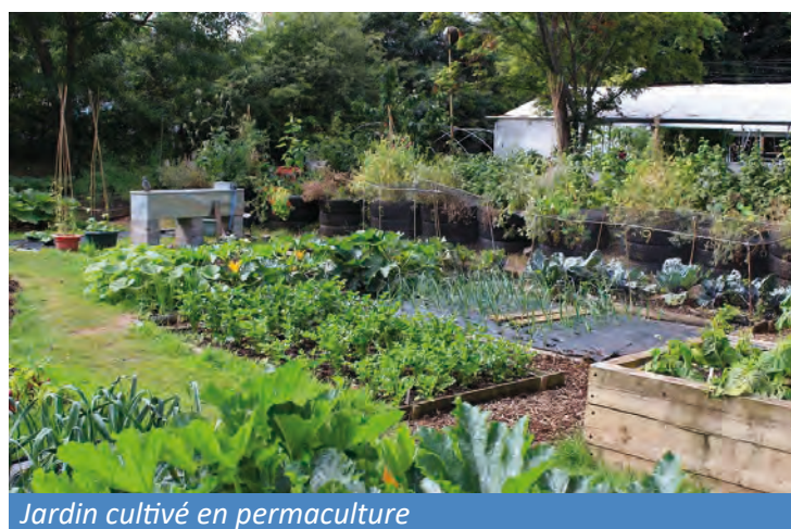
Jardin cultivé en permaculture

Ne les jetez pas dans la poubelle ou dans la nature, les cours d'eau ou les fossés ! Les flacons et bidons vides, ouverts et/ou inutilisés doivent être apportés dans une déchetterie où ils rejoindront une filière spécifique aux déchets chimiques. Vous pourrez aussi les déposer dans certaines jardineries.