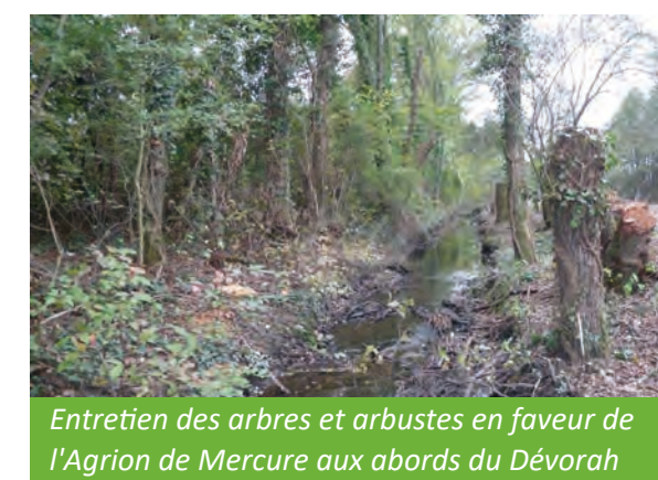
Entretien des arbres et arbustes en faveur de l'Agriion de Mercure aux abords du Dévorah