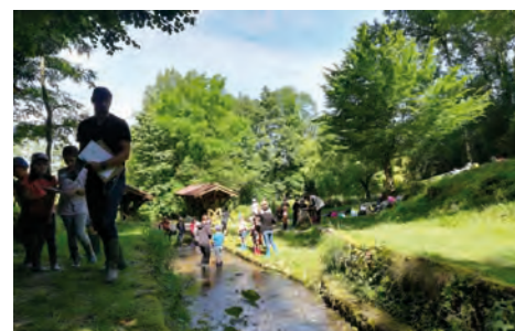
Les CP / CE1 de l'école de Chavannes-sur-Reyssouze à la découverte de la Reyssouze

Cette année, plus de 400 élèves ont pu découvrir la Reyssouze et ses affluents par le biais d'animations conçues sur la thématique de l'eau, des milieux aquatiques, de la biodiversité et des activités et usages de l'eau.