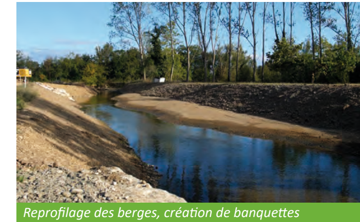
Reprofilage des berges, création de banquettes